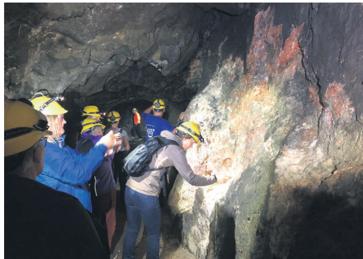
Mineralet stillbitt finst i ein sjeldan, lakseraud variant i sinkgruvane i Sauda.

I dag framstår Allmannajuvet som eitt av dei mest spektakulære stoppunkta langs Nasjonale turistvegane. Dei nyeste bygningane i anlegget er konstruert av den sveitsiske arkitekten Peter Zumthor,