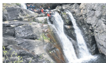
Er du ute etter ett adrenalinkick er juving noe for deg! Turen gir godt sug i magen og du vil kjenne på høyden. Du følger elva, ned naturlige sklier, slik som denne på bildet. Turen avsluttes med en høy via ferrata.