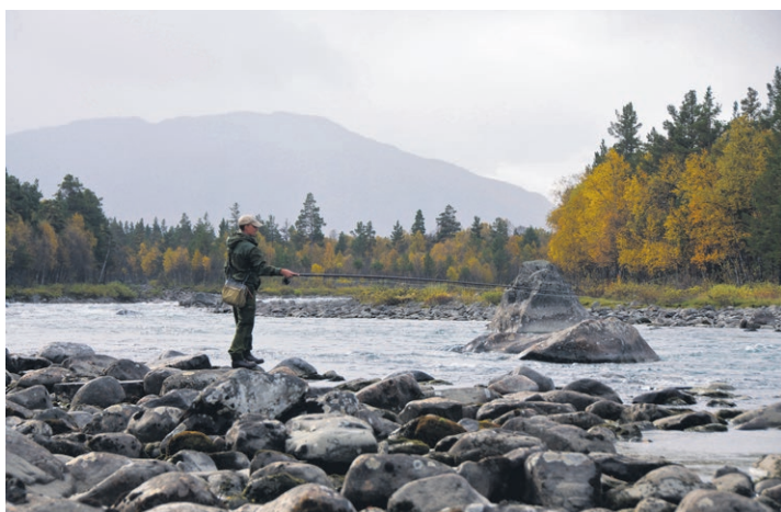
Fisking i Sjøa.