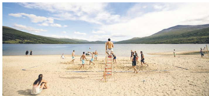
I Gjevilvassdalen finner du Rauøra, ei sandstrand midt blant fjellene, hvor du kan ta et forfriskende bad i klart fjellvann. Her er det også fint å overnatte i telt eller hengekøye, husk fiskestang, kanskje du får en fjellørret på kroken!

Moskussafari, elgsafari, rafting, juving og zipline-parker er blant aktivitetene man kan bryne seg på i fjellbygda, hvis man da ikke bare pakker sekken og vandrer av gårde ut i fjellheimen i trygge omgivelser med et hav av plass å områ seg på. I Oppdal er det utsiktssteder på hver en topp.