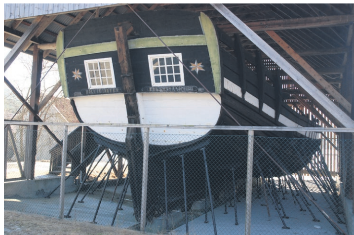
Holvikeyekta er den einaste i sitt slag i landet.

Gloppen i Nordfjord, i hjartet av fjord-Noreg, har mykje å by på. Blenkjande fjordar og vatn, omkransa av grøderike bygder og høge fjell i eit landskap som kan ta pusten frå dei fleste.