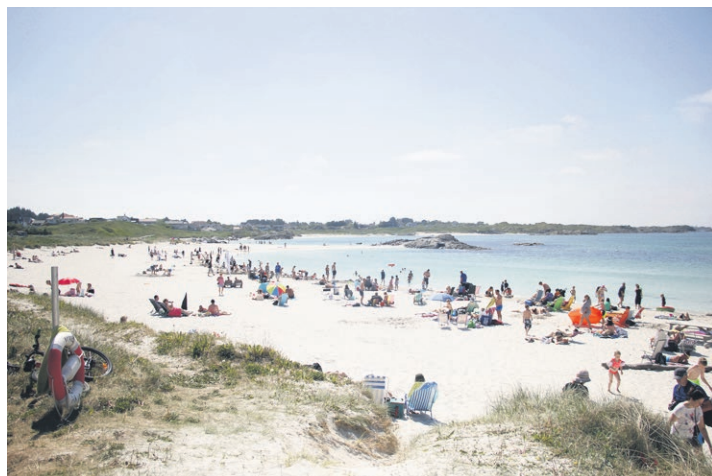
Åkrasanden er en av Norges flotteste strender.

For å avrunde din Karmøyferie; avslutt med en tur til Avaldsnes – Norges eldste Kongesete. Få et innblikk i hvordan det var å leve på vikingtiden. Opplev Olavskirken, ta en tur til historiesenteret, og la deg fascinere av vikinggården. Her ble deler av den populære TV-serien Vikingane spilt inn.