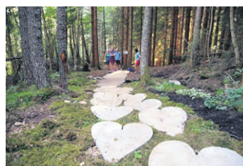
Trivselskogen ved Sandane sentrum er blitt ein attraksjon.

Når auga treng kvile, er det gode senger på det historiske, prislona Gloppen Hotell, eller kanskje freistar det å prøve Engeset Trehytter, med spektakulær utsikt over den vakre bygda – midt i verda.