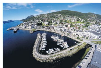
Volda sentrum er ein koseleg handelsstad ved fjorden, der du finn det aller meste. Volda er spesielt er kjent som aktiv skulestad.

Mange tilbud: På Kometland finn du Noreg sitt største amatør astronomisenter. Området har mange populære lakseelvar, mange museum, med mellom anna Fyr-museum, Aasen-tunet, trykkeri-museum og Anders Svor museum. Sjøorm i Hornindalsvatnet. Mange badeplassar. Sandvolleyballbaner. Leike- og skatepark. I Volda finn du godt miljø og anlegg for både