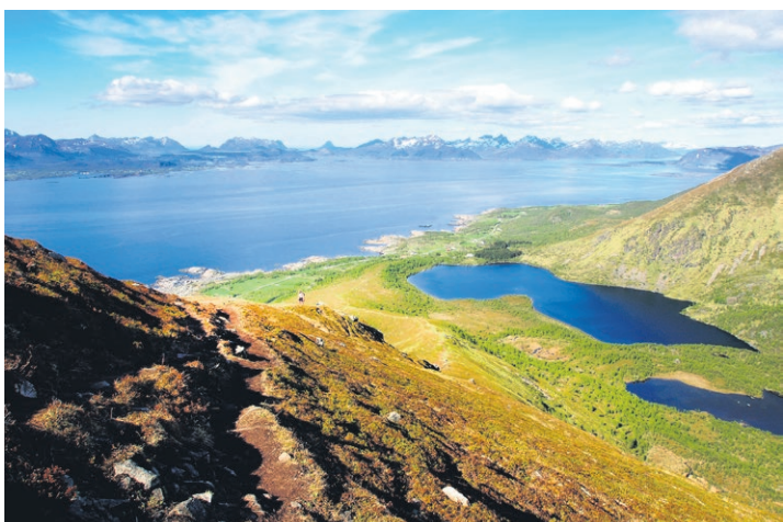
Utsikt: Hadseløya byr på varierte opplevingar. For dem som vil gå i fjellet eller fiske i vannene er det tilrettelagt med stier og merkede løyper. Veien rundt øye er flat og trygg for syklistar. Skjærgården byr på variert farvann med holmer og strender for kajakkpadlere.

Sentral plassering: Volda ligg sentralt til i regionen og har gode kommunikasjonar. Det er gode tilbud på hotell, airbnb, hytter og camping. Dermed er Volda ein sentral plass å bu om ein skal oppleve området, som ligg nær opp til verdsarvområdet for Vestnorsk fjordlandskap. Hovudattraksjonen er Geirangerfjorden, men det er på sin plass å minne om alle dei vakre fjordane i Volda-området.