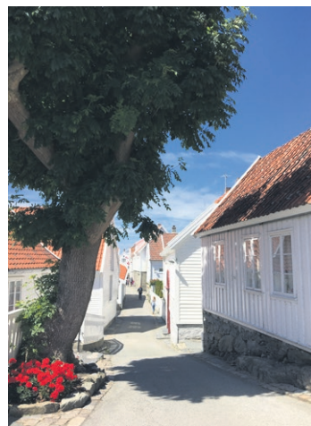
Idylliske Gamle Skudeneshavn er på den eksklusive listen over Riksantikvarens fredete kulturmiljøer.