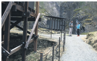
Kafébygg til venstre, visningsbygg i bakgrunnen.

I 1881 oppdaga husmannen Grigar Sabojen sinkmalm i Allmannajuvet, ei dryg mil aust for Sauda sentrum. Funnet gav opptakten til eit lite gruveeventyr i den tronge fjelldalen, der det i løpet av dei 18 åra det var drift blei henta ut 12 000 tonn sinkmalm. På det meste arbeidde 168 mann i gruvane.